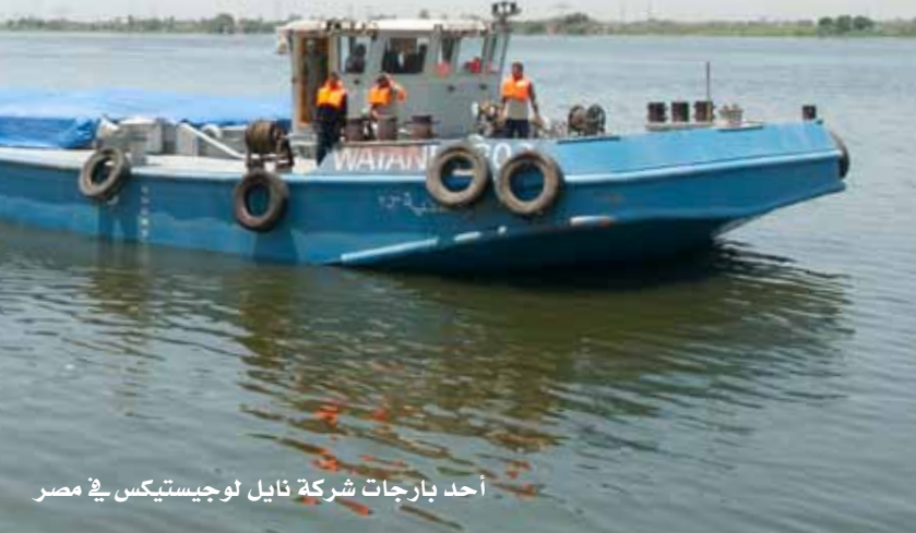
أحد بارجات شركة نايل لوجيستيكس في مصر