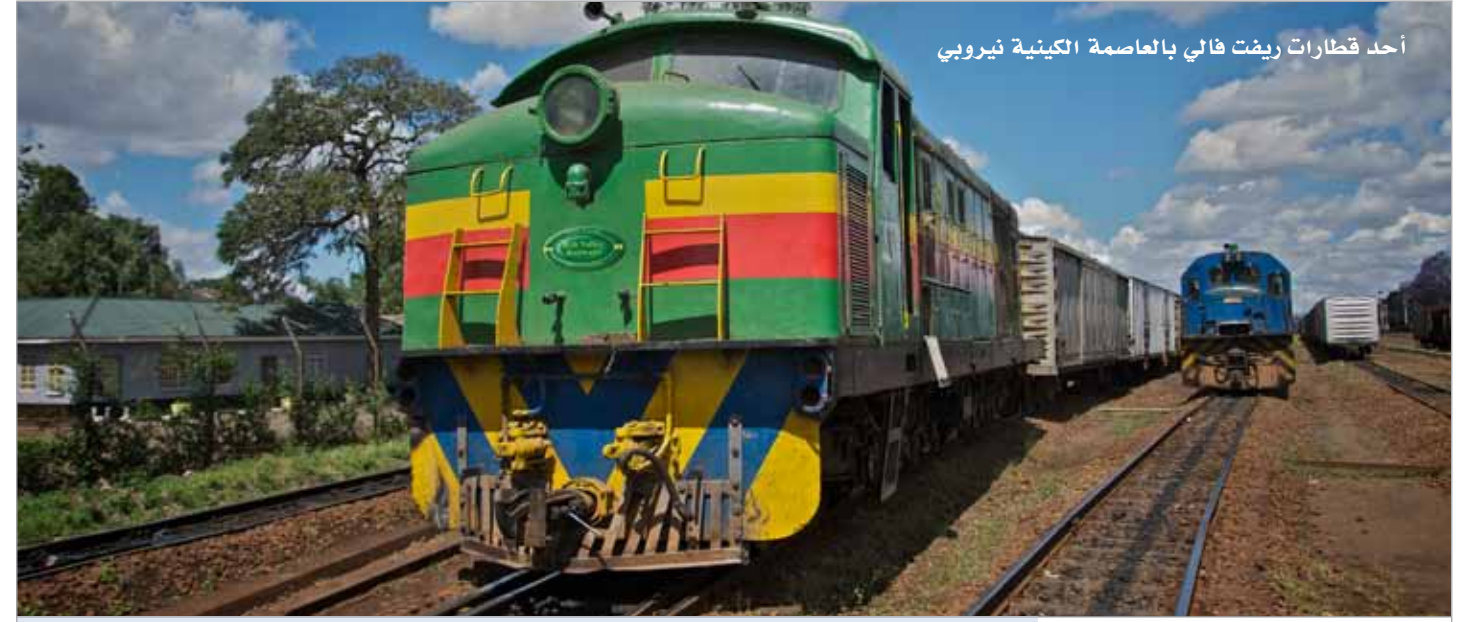
أحد قطارات ريفت فالي بالعاصمة الكينية نيروبي

قاطرة جديدة تم إضافتها لأسطول السكك الحديدية خلال عام ٢٠١٥