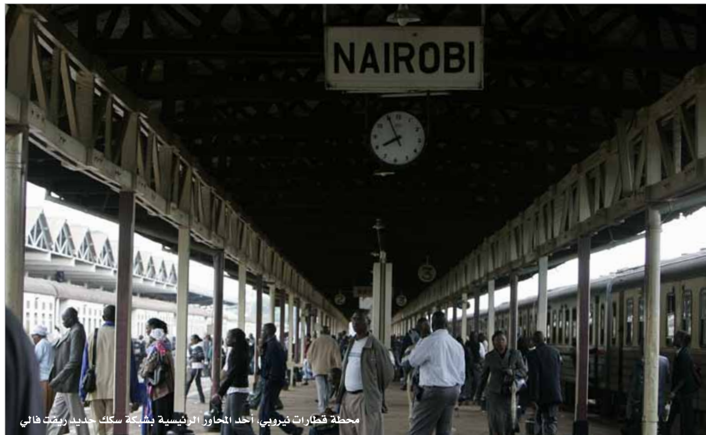
محطة قطارات نيروبي، أحد المحاور الرئيسية بشبكة سكك حديد ريفت فالي